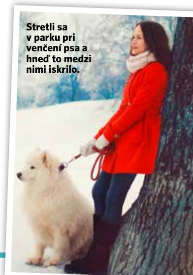
Stretli sa v parku pri venčení psa a hneď to medzi nimi iskrilo.

plnené potreby, túžby, prania a je prirodzené chcieť mať naplnené to, čo nám chýba. V zdravom pevnom partnerstve majú partneri odvahu byť otvorení, sami sebou aj v zraniteľnosti, cítia sa bezpečne jeden pri druhom, nech by hovorili o čomkoľvek. Preto spoločne nielen čelia prekážkam, ale vzťah tvoria tak, aby sa v ňom obaja cítili dobre a naplnene. Bežnejšia je však forma úniku, čo je odpoveď na to, prečo je „zakázané ovocie“ také lákavé a príťažlivé.